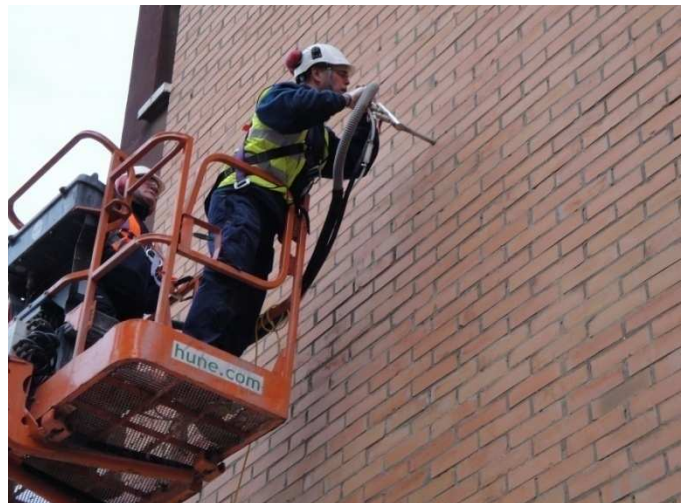
Figura 6.2: Inyección del sistema ThermaBead.

En caso de desajuste, debe repetirse el ensayo de flujo antes de continuar con la inyección del sistema.