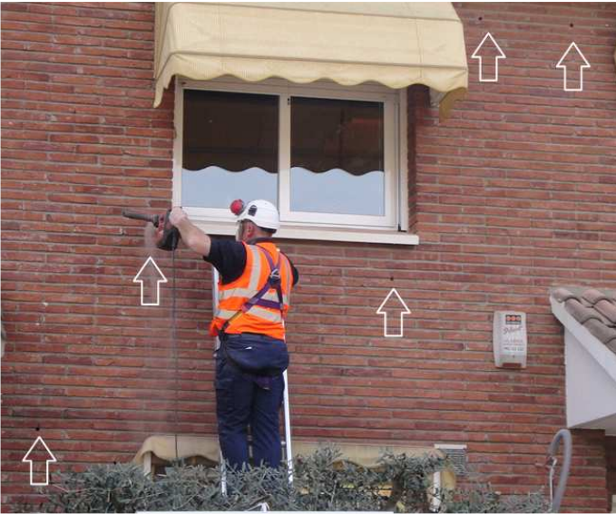
Figura 6.1: Perforación de la fachada según el patrón establecido.

evitar que el polvo formado al taladrar caiga sobre el aislante a medio inyectar.